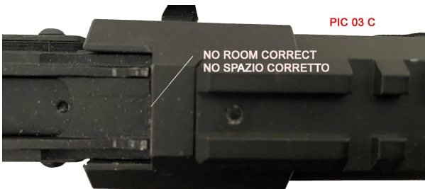
PIC 03 C

IF REQUIRED GENTLY RIBBON HAMMER SE NECESSARIO USARE UN MARTELLO DI GOMMA