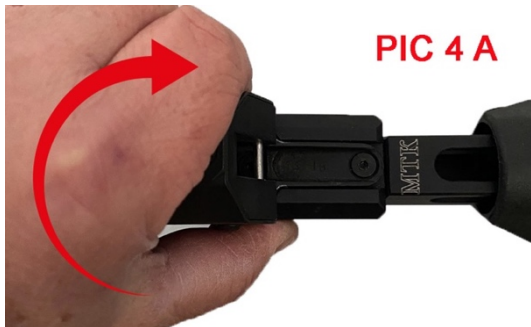
PIC 4 A

DUST COVER CORRECTLY MOUNTED DUST COVER MONTATO CORRETTAMENTE