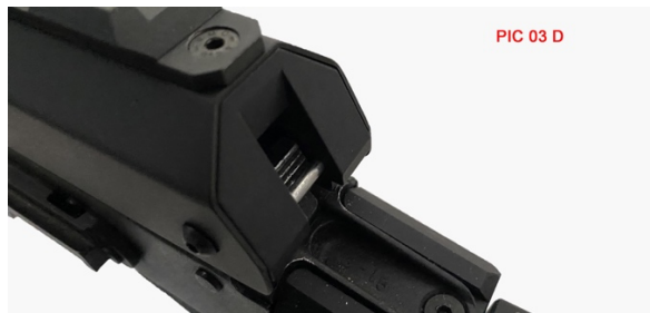
PIC 03 D

FORK INSERT MUST TOUCH L'INSERTO A FORCHETTA DEVE TOCCARE