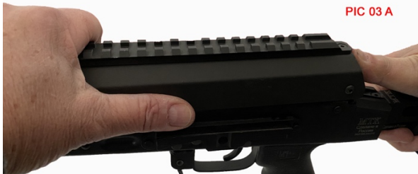
PIC 03 A

INSERT FRONT SLIDING ON FRAME INSERIRE IL DENTE SCORRENDO SUL FUSTO