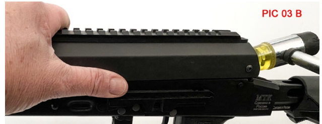
PIC 03 B

FORWARD PUSH DOWN - BACK PUSH FORWARD DAVANTI PREMERE IN BASSO DIETRO VERSO AVANTI